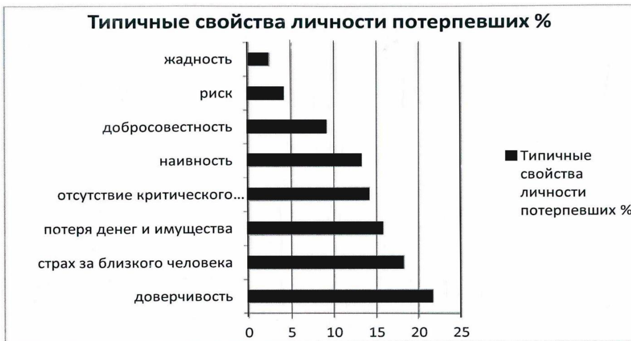
Рисунок 2 – Типичные свойства личности потерпевших