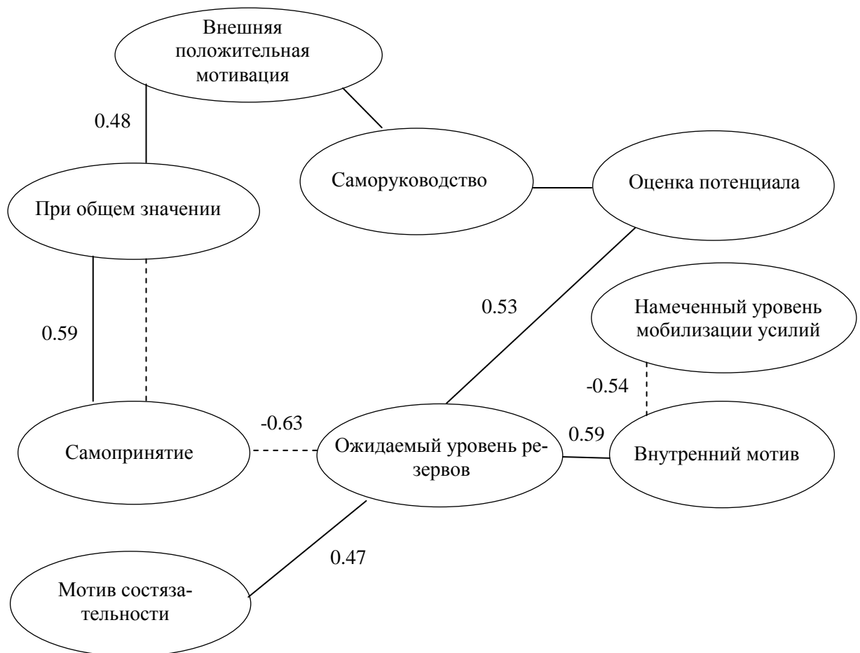
Рисунок 1 – Взаимосвязи исследуемых показателей у курсантов первого курса обучения.

но коррелирует с переменной «самопринятие» (-0,63; p < 0,01 ). То есть, стремление к успешной карьере военнослужащего, достижению высоких целей и повышению собственной значимости у курсантов первого курса сформировалось под действием вышеперечисленных переменных. Такие курсанты сознательно выбрали военную карьеру и приложили для поступления в военный университет, заранее спланированный уровень усилий. Можно утверждать, что мотив выбора военной специальности был не случаен, а явился следствием осознанного выбора. Об этом же свидетельствуют взаимосвязь оценки потенциала и ожидаемый уровень достигнутых ещё в школе результатов (когда они решили, что их потенциал достаточен для того, чтобы поступить в ВООВО).