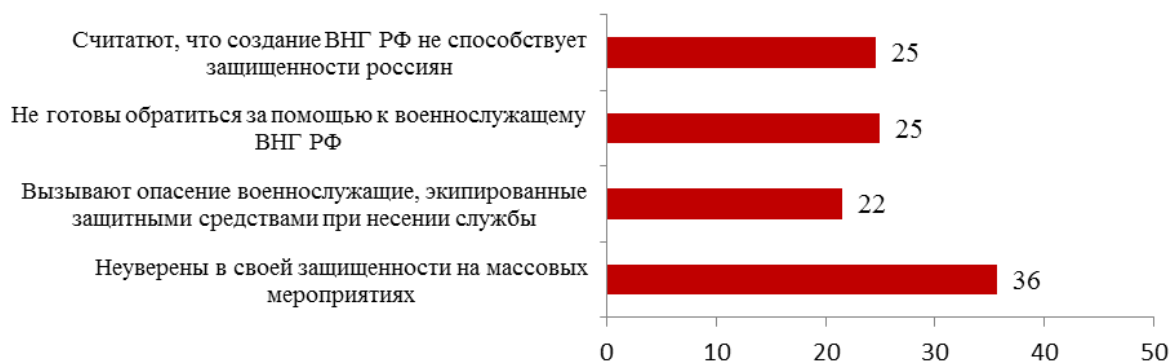
Схема 2 – Негативные оценки по отношению к военнослужащим войск национальной гвардии Российской Федерации (%)

Исходя из сложившейся ситуации недоверия к