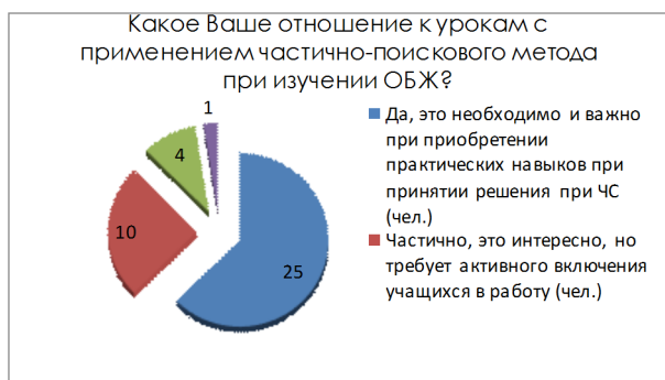
Рисунок 9 – Какое Ваше отношение к урокам с применением частично-поискового метода при изучении ОБЖ?

На основе данных приведенных выше графиков можно делать следующие выводы: