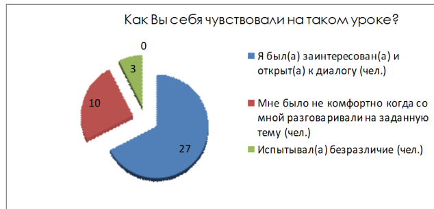
Рисунок 4 – Как Вы себя чувствовали на таком уроке?

Данный опрос показал, что ученики были увлечены и заинтересованы в диалоге с практикантом по данной теме. Им было комфортно и интересно находиться на уроке и получать новую информацию (рисунок 4). Можно сделать вывод, что частично-поисковый метод ведения урока привёл к нужным результатам усвоения учебного материала учениками.