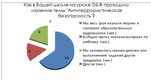
Рисунок 3 – Как в Вашей школе на уроке ОБЖ проходило изучение темы «Антитеррористическая безопасность»?

Школьники отметили, что большее количество времени на уроках ОБЖ учителя отводили лишь на теоретические знания и наглядные примеры, приведенные в учебных видеороликах, но не практическим знаниям и беседам по этой теме (рисунок 3). Так же было отмечено, что некоторые преподаватели разрешали в течение урока заниматься ученикам посторонними делами, не связанными с учебным процессом на уроке ОБЖ.