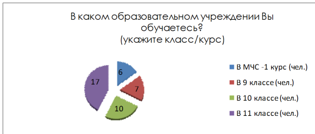
Рисунок 1 – В каком образовательном учреждении Вы обучаетесь? Укажите класс/курс

России, которые проходили педагогическую практику в данной школе (6 человек). Программа в учебных пособиях этих классов включает в себя изучение темы «Антитеррористическая безопасность» (рисунок 1).