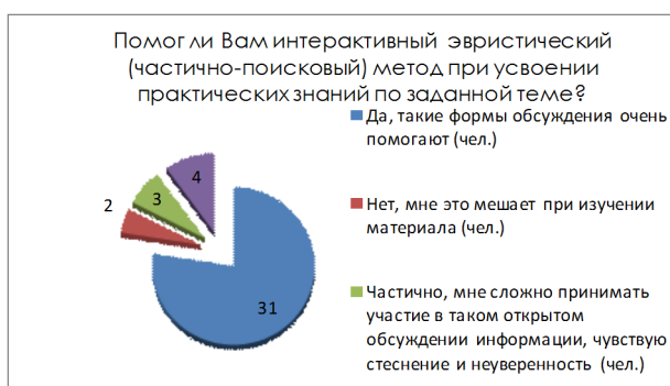
Рисунок 8 – Помог ли Вам интерактивный эвристический (частично-поисковый) метод при усвоении практических знаний по заданной теме?