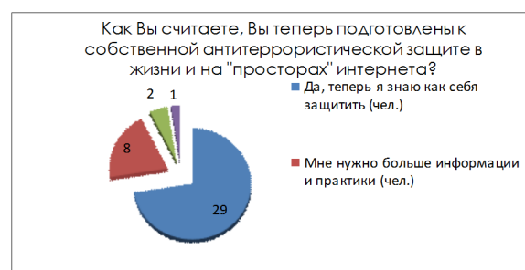
Рисунок 6 – Как Вы считаете, Вы теперь подготовлены к собственной антитеррористической защите в жизни и на «просторах» Интернета?

Ученики высоко оценили уровень знаний, данный им на уроке по антитеррористической безопасности. С помощью частично-поискового метода ведения обучения, практикант смог донести новую, неизвестную для учеников информацию и помог ее усвоению (рисунки 6–9).