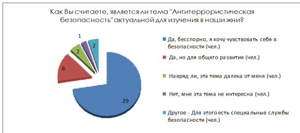
Рисунок 2 – Как Вы считаете, является ли тема «Антитеррористическая безопасность» актуальной для изучения в наши дни?

Для подавляющего большинства респондентов урок по теме «Антитеррористическая безопасность» является актуальным для изучения, в том числе и в школьной программе (рисунок 2).